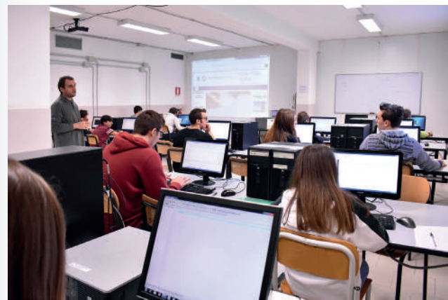
Laboratorio di informatica