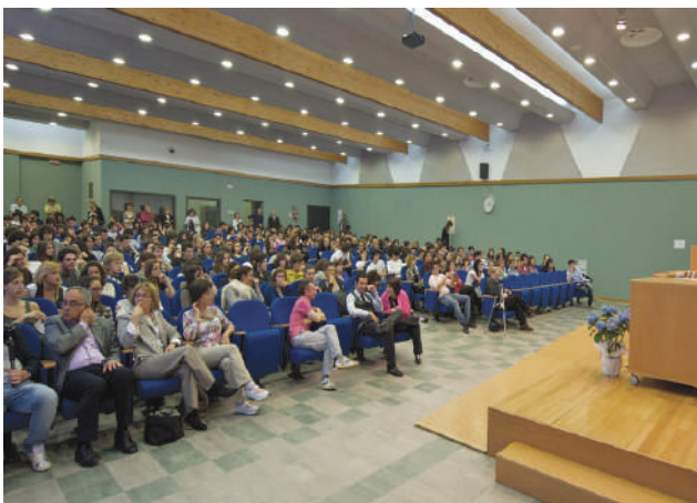
Auditorium "Rita Levi-Montalcini"

Il diploma di Liceo Scientifico offre una formazione completa per l'accesso a tutte le facoltà universitarie.