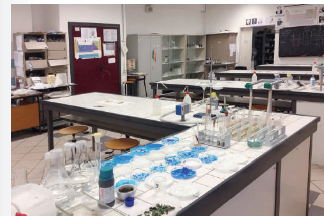
Laboratorio di chimica